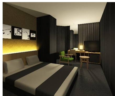
デラックスダブル