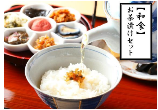
【和食】 お茶漬けセット

旅の楽しみのひとつでもある“食”にもこだわりました。朝食は、焼き魚と玉子焼きなどがついた「お茶漬けセット」の和食と洋食のセットをご用意しています。サラダバー・ドリンクバーもご利用いただけます。