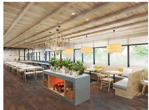
2階レストラン イメージ