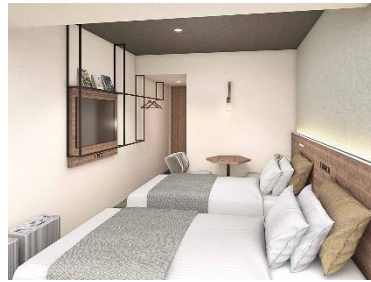
デラックスツイン